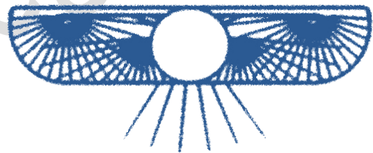
Il disco alato, simbolo zoroastriano del dio Auramazda e del dio egizio Aton .

dallo schema materiale mediante l' azione della forza distruttiva, essa ritorna istantaneamente usabile dalla forza creativa che la ridistribuisce secondo un nuovo ordine . Ne consegue che tutto ciò che è concepibile nelle idee esiste su un altro piano della realtà; quindi le idee sostenute dalla forza spirituale, possono successivamente prender forma nella dimensione materiale, man mano che la quantità di energia necessaria si ordina nello schema corrispondente . Non è forse questo ciò che vediamo in atto quando realizziamo i nostri progetti?